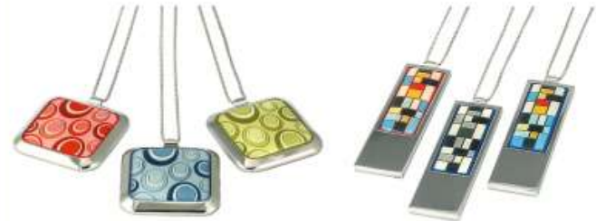
punch blue - pink - tan