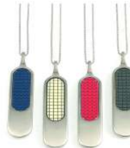
formula blue - cream - red - gray