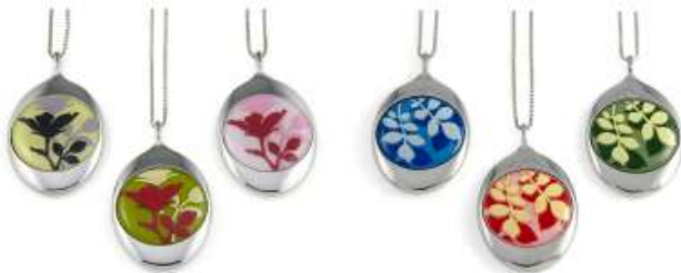
rose yellow - green - mauve