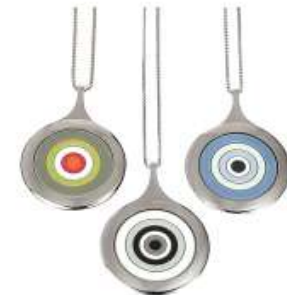
bullseye green - white - blue