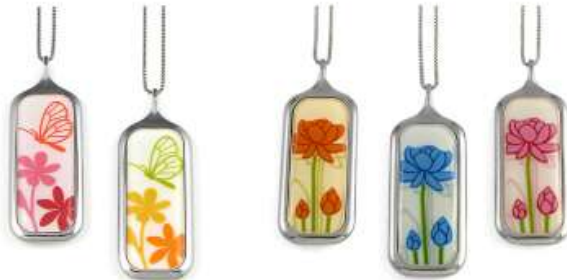
butterfly red - yellow