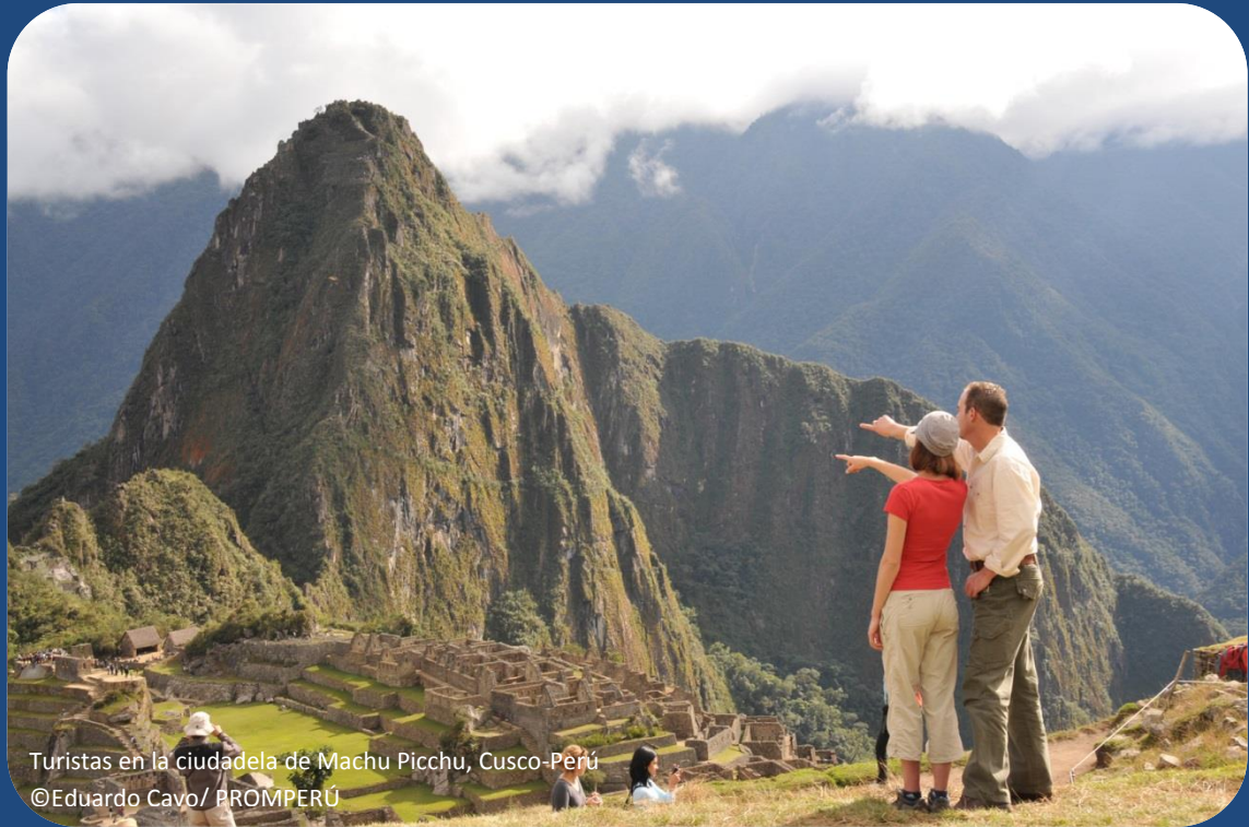
Turistas en la ciudadela de Machu Picchu, Cusco-Perú