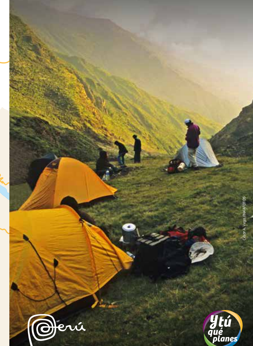
César A. Vega / INKAFOTOS