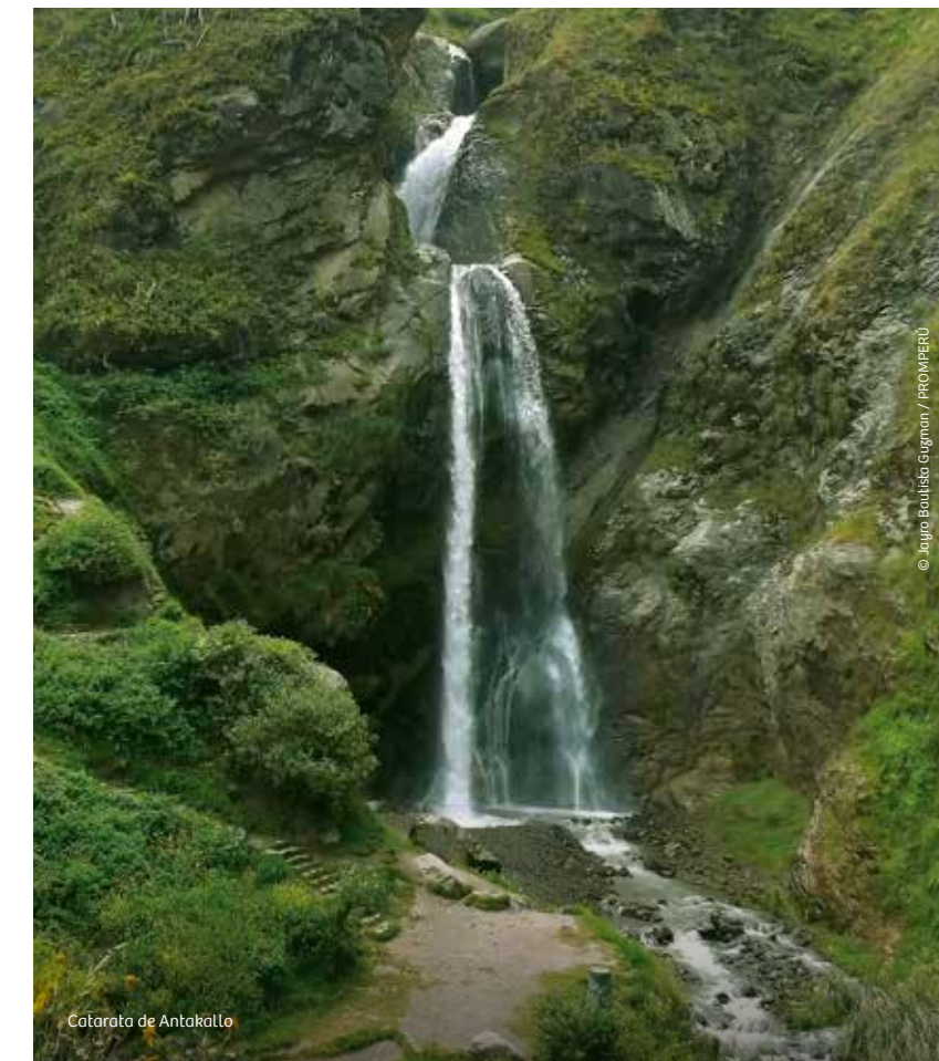
Catarata de Antakallo