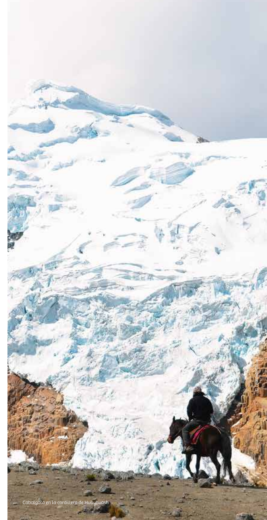
Cabalgada en la cordillera de Huayhuash