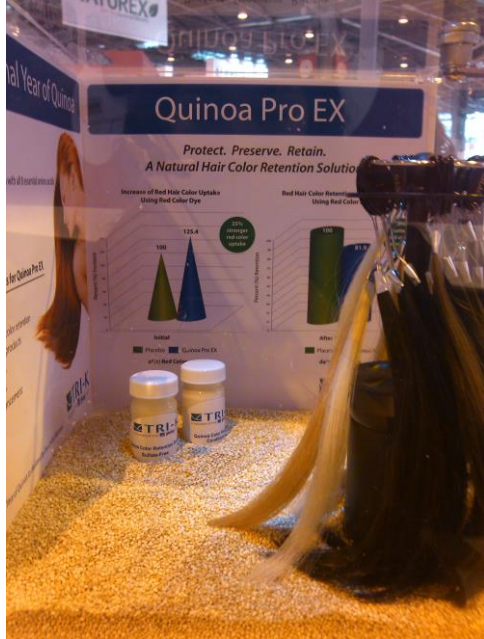
Proteína de quinua para usos en productos para el cuidado del cabello de la empresa Tri-K Industries en la zona de la innovación

biodiversidad nativa de países megadiversos tales como la guava, quinua, acerola, maracuyá e incluso de las cerezas (como aguas, sustitutos del agua convencional)