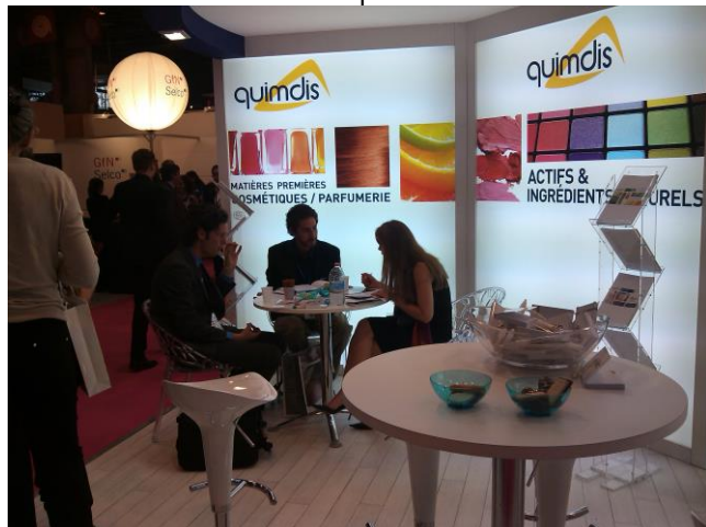
Representante de la empresa Amazon Health Products en reunión con comprador internacional Quimdis

Con las cuales se desarrolló una agenda con empresas expositoras que cuentan con la oferta de productos afín y que mostraron interés en la oferta peruana.