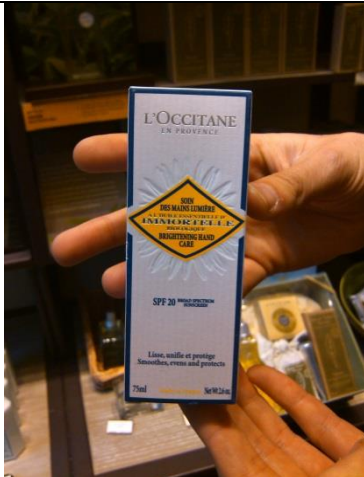
Crema de manos a base de Inmortelle (Siempreviva) – La línea de cuidado para la piel con este ingrediente fue lanzada el 2002 por la empresa