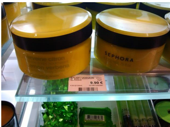
Crema humectante para el cuerpo con Verbena

Para el caso de esta empresa, la línea de productos con marca propia es una propuesta de productos para el cuidado personal inspirados en lo natural, en donde la proporción de ingredientes naturales en la formulación es mucho menor. Asimismo la estrategia de Sephora es el de "seguidores", es decir un enfoque de desarrollo de productos basado en los lanzamientos de otras marcas y en función a la popularidad de los nuevos ingredientes.