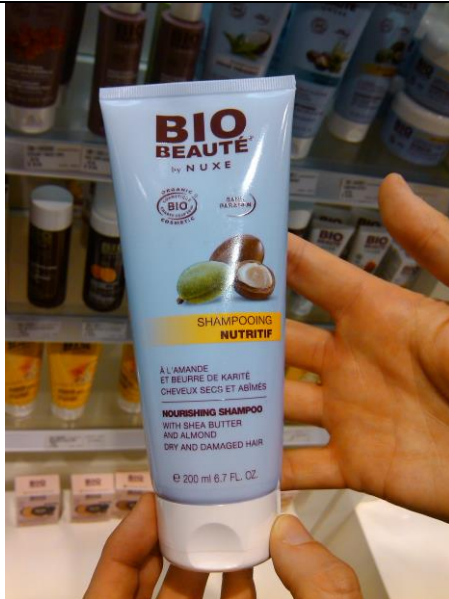
Shampoo orgánico de la Línea BIO de NUXE – Nótese que cuenta con aceite de almendras y manteca de karité