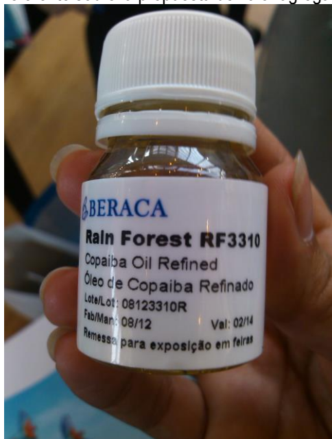
Aceite refinado de Copaiba - Beraca

Beraca se mantiene como empresa representativa de la oferta de ingredientes sobre la biodiversidad amazónica. Con una gama de productos tanto a nivel de extractos, como aceites y arcillas minerales para el cuidado de la piel, es un referente sobre la propuesta de valor agregado que se tiene que dar a la oferta peruana.