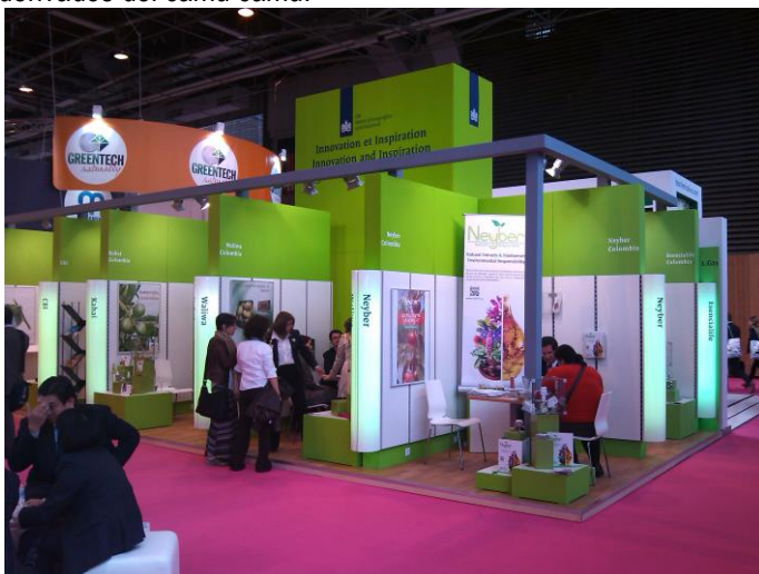
Pabellón de empresas apoyadas por CBI

Entre la oferta de las empresas colombianas se observó la empresa Neyber cuyo producto principal eran aceites derivados del camu camu.