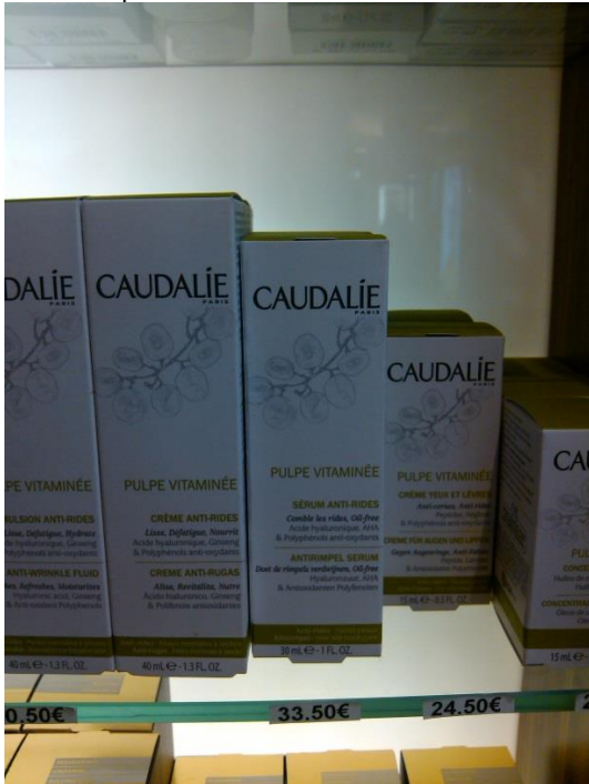
Crema antiarrugas de la marca Caudalie