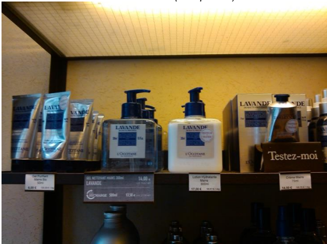
L'Occitane - Línea de cuidado para la piel de lavanda