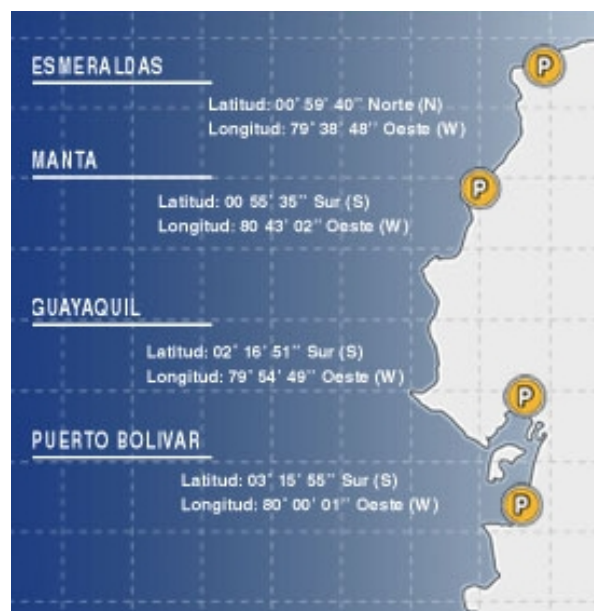
Gráfico 3: Puertos en Ecuador

Los principales aeropuertos en Ecuador son el Mariscal Sucre en Quito y el Simón Bolívar en Guayaquil 7 .