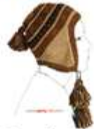
Peruvian Hats - Chullos