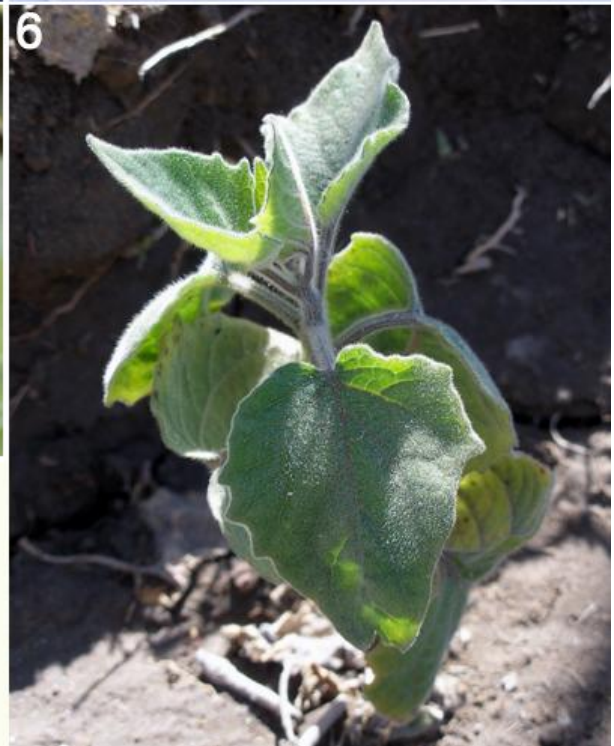
1, 2) Flores de Physalis peruviana ; 3) Fruto; 4) Fruto; 5) Hoja; 6) Plántula