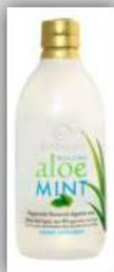
Suplemento Dietético Aloe con Menta