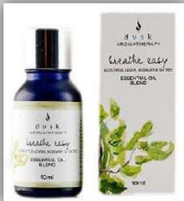
Ambientador con olor a Eucalipto US$ 15.5