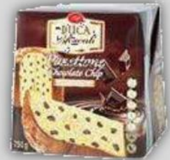
Panetón con Chocolates o Frutas US$ 2.9