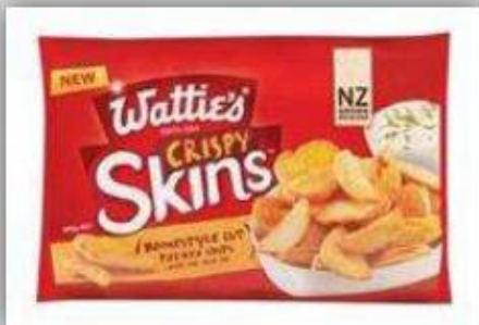
Papas en trozos, congeladas US $ 4.1