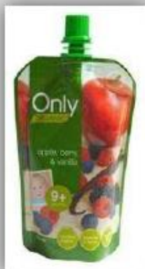
Comida Orgánica para Bebés