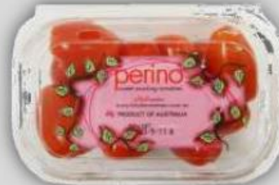
Tomates Dulces tipo Snack US$ 4.1