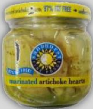
Corazones de Alcachofas Marinadas US$ 2.0