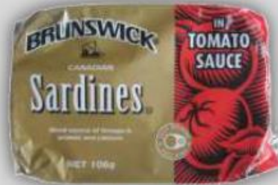
Sardinas en salsa de Tomate US $ 1.5