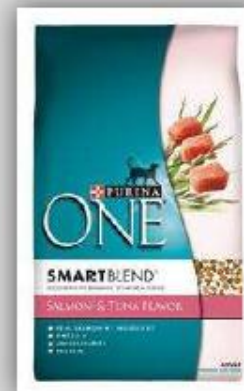
Comida para gatos Salmon y Atún