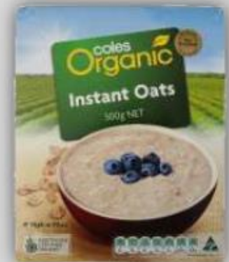
Avena Orgánica Instantánea US$ 3.1