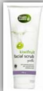
Loción Facial A base de Kiwi