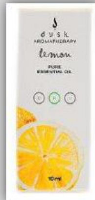
Ambientador a base de frutas y manzanilla