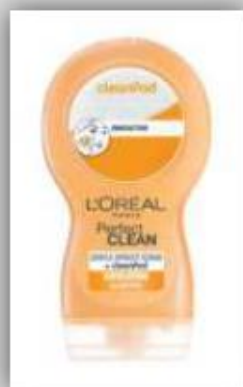
Loción exfoliante A base de Damasco