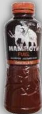
Leche Chocolatada US$ 3.1