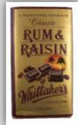
Barras de Chocolate Cacao US$ 7.5