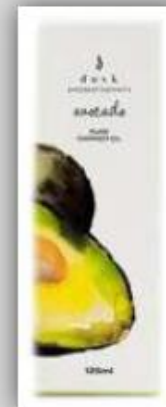
Aceite de Palta para el Cuerpo US$ 18.6