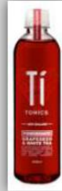
Grapseed & White Tea Mora, Durazno, Maracuyá, Granada US$ 31.8 (12 UNID)