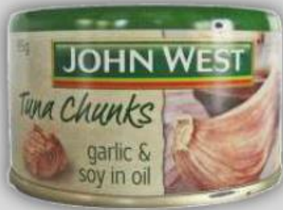
Atún en salsa de Ajo US $