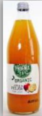
Jugo Orgánico Manzana, Mango, Maracuyá US$ 2.8