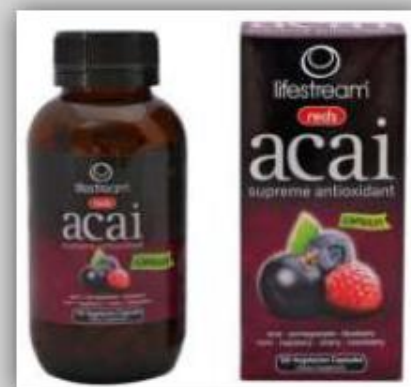
Suplemento Orgánico Acai A base de Noni orgánico y frutas orgánicas