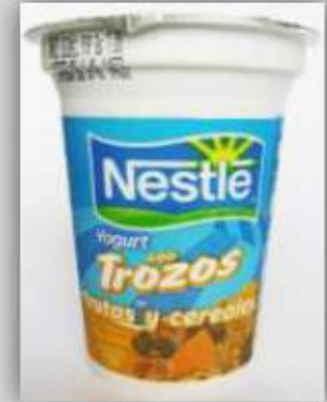
Yogurt con Frutas y Cereal Plátano, Maracuyá, Durazno, Piña US$ 1.4