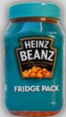
Frijoles Horneados en empaque refrigerado US$ 4.8