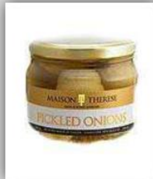
Cebollas en conserva