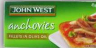
Anchovetas en Aceite de Oliva US$ 2.8