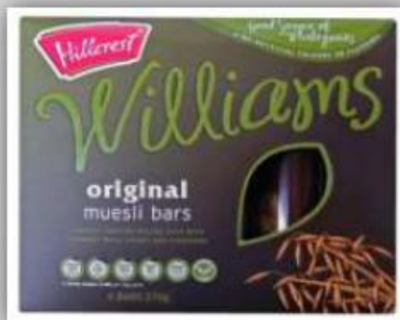
Muesli Bars US$ 3.8