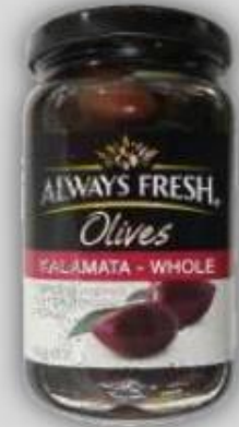
Aceitunas Negras US$ 4.1