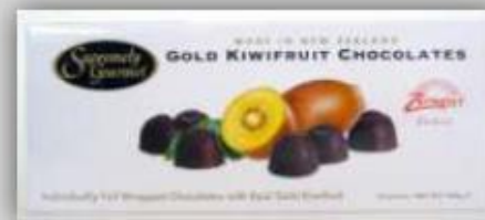
Chocolates con Relleno: Grosella Negra, Kiwi, Mango US $ 15.8