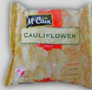
Coliflor congelado US$ 3.0