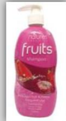
Shampoo a base de frutas US$ 3.1