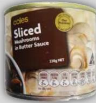
Hongos en Rodajas en Salsa de Mantequilla US$ 1.3