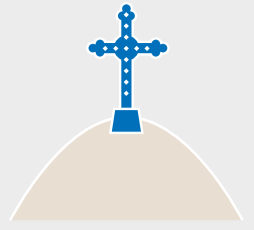
Cerro San Cristóbal