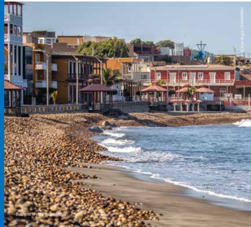
Balneario de Pacasmayo

Monumental edificio de 1871, construido en épocas de bonanza económica, social y cultural del antiguo puerto de Pacasmayo. Conserva en sus ambientes vestigios restaurados de locomotoras, vehículos y rieles que fueron utilizados en la otrora estación que comunicaba La Libertad y Cajamarca.