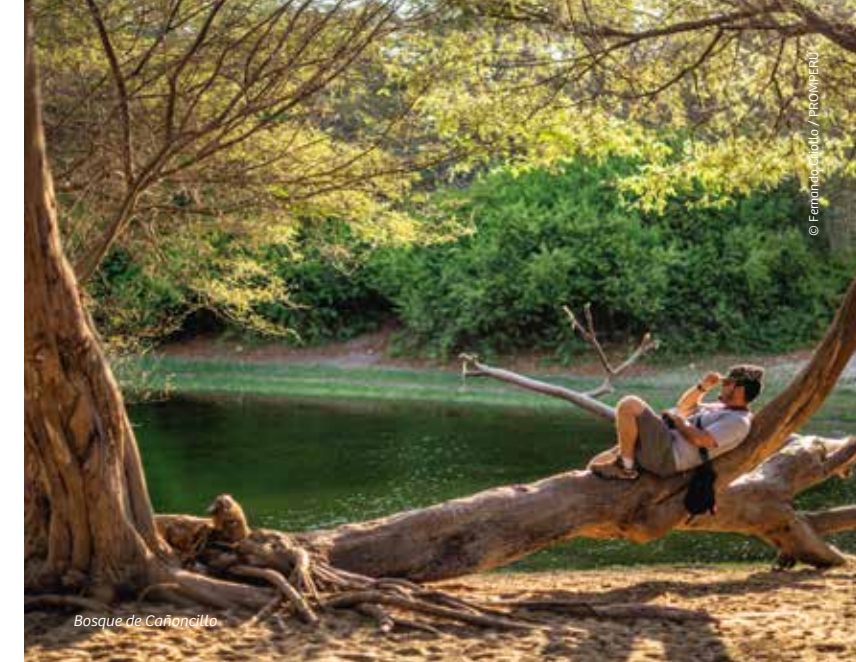
Bosque de Cañoncillo

Sencilla y tranquila caleta de pescadores, con orillas de piso rocoso y caballitos de totora que observan desde la orilla. Para encontrar playas de arena aptas, se debe viajar otros 3 km al norte, de preferencia en camioneta.