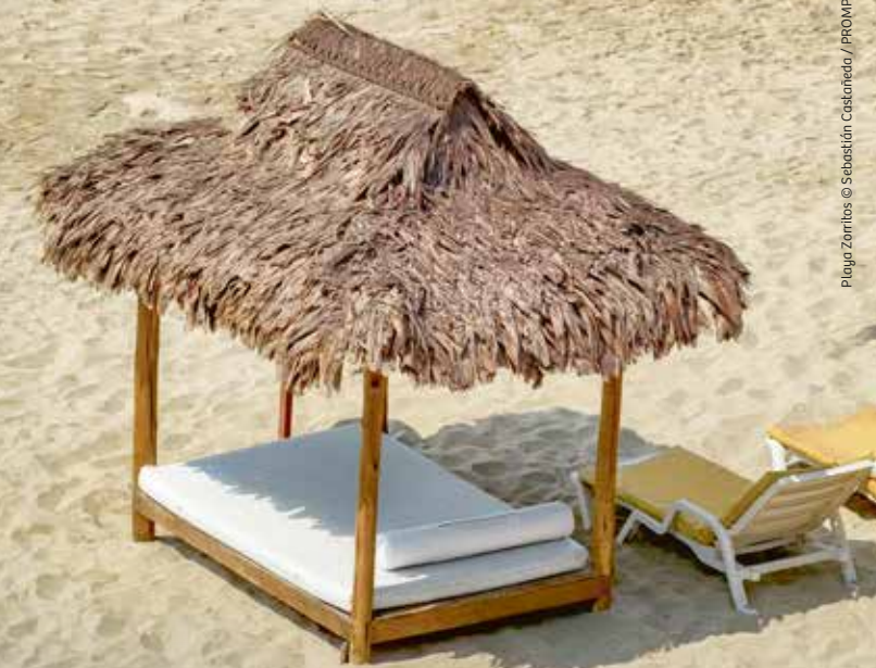
Playa Zorritos

Reinos de arena y mar Rutas cortas desde Piura