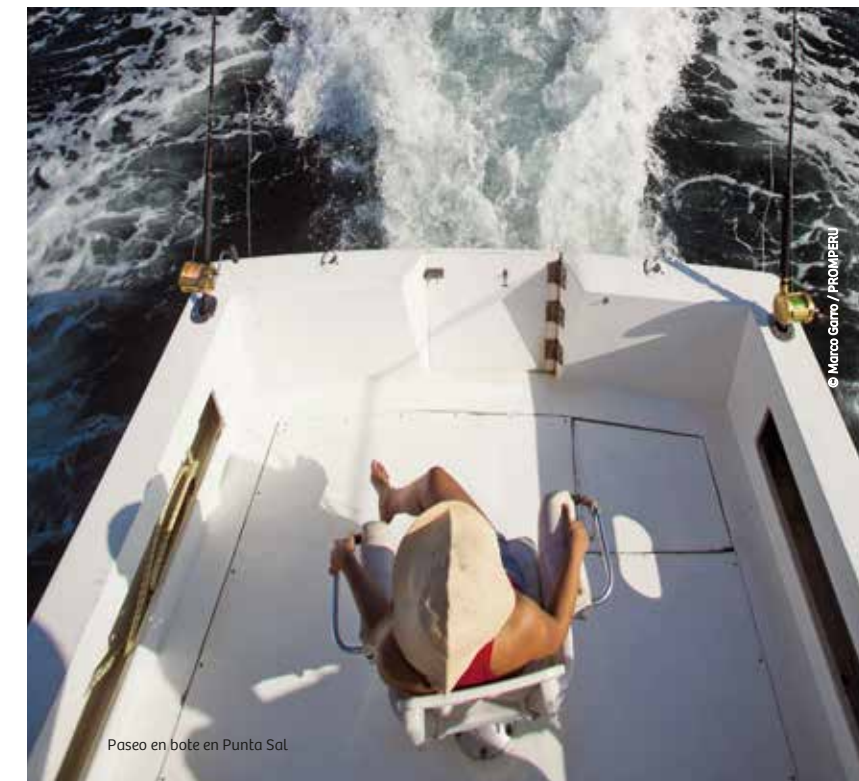
Paseo en bote en Punta Sal