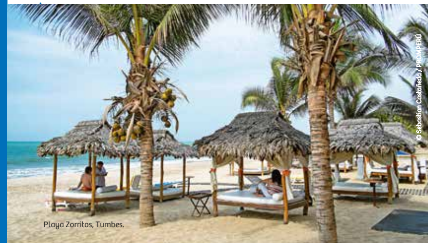
Playa Zorritos, Tumbes.

Es un pintoresco punto del litoral de mar tranquilo y arena fina. Su riqueza ictiológica es aprovechada por los pobladores, sobre todo por la gran producción de ostras, langostas y ostiones.