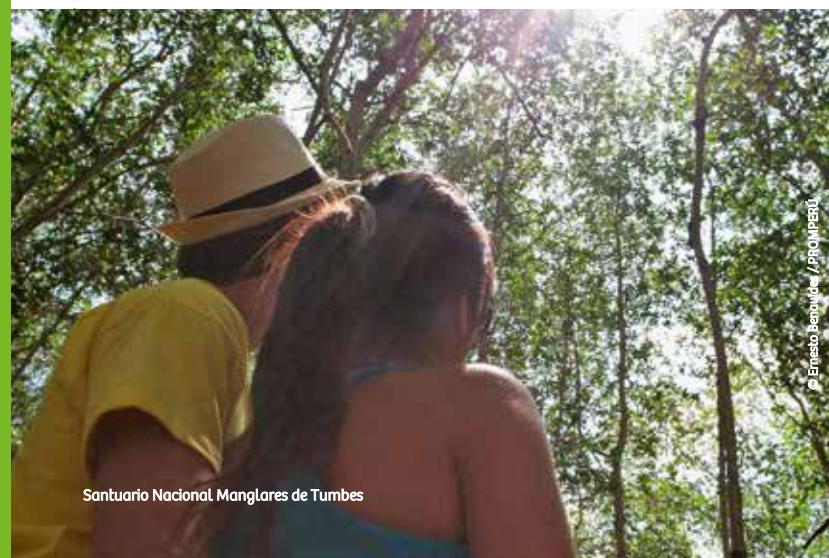
Santuario Nacional Manglares de Tumbes

Siente el contacto directo con la naturaleza al estar rodeado de árboles frondosos y altos que le dan el nombre al lugar; admira el trabajo de hábiles cangrejos del manglar y apreciadas conchas negras. Visita también las islas Almejas, Roncal, Correa y Matapalo, donde fragatas de pecho rojo, ibis, garzas tigris, y otras aves surcan el cielo limpio ofreciendo un bello espectáculo.