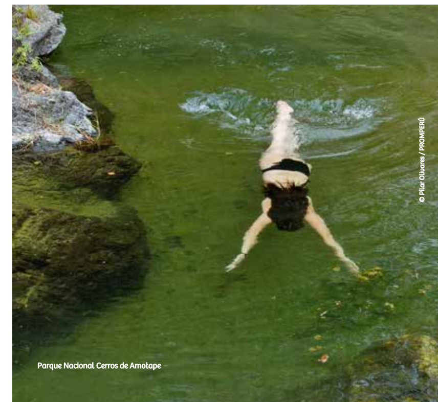
Parque Nacional Cerros de Amotape