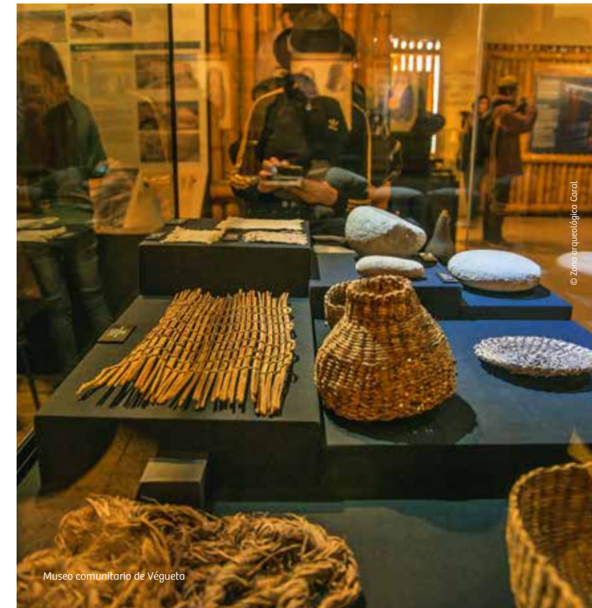
Museo comunitario de Végueta