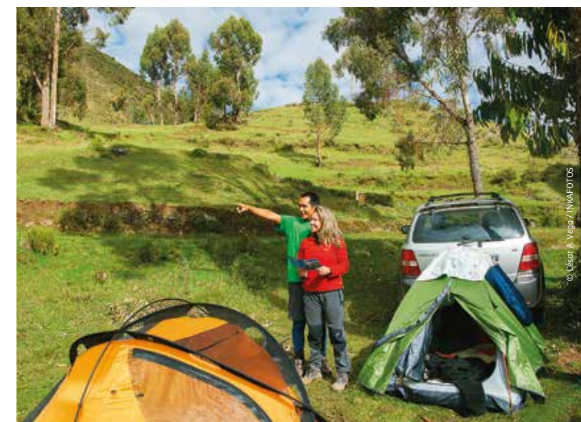
Campamento en Vilca.