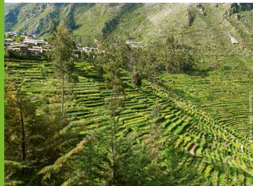
Andenes en Laraos

Este pueblo muestra orgulloso su antigua iglesia y el riguroso trabajo artesanal que exhibe su interior. A dos horas a pie se ubica Huamanmarca, vestigios de construcciones de los Yauyos (900 y 1400 d. C.). De camino a este sitio arqueológico encontrarás milenarios andenes, que aún se mantienen operativos.