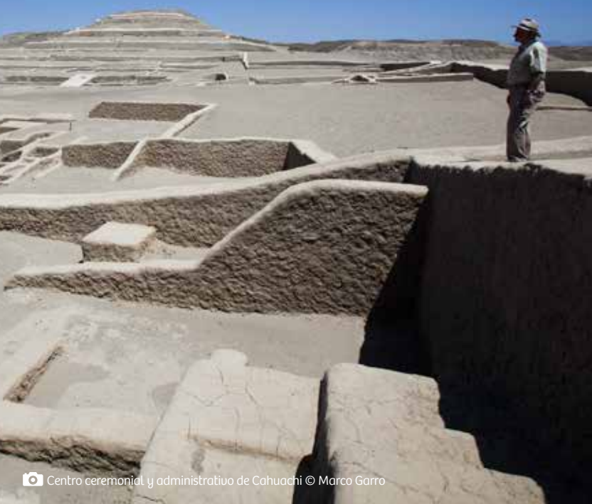
📷 Centro ceremonial y administrativo de Cahuachi