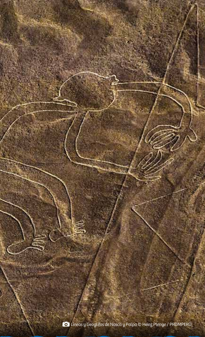
📷 Líneas y Geoglifos de Nasca y Palpa