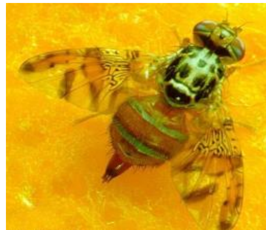
Moscas de la fruta