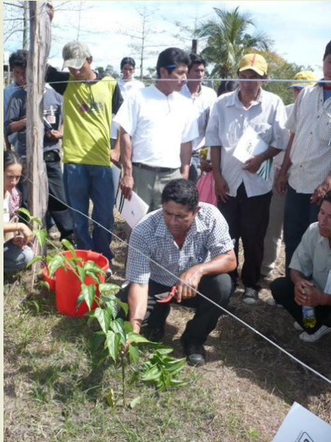
Transferencia de capacidades a proveedores: Shanantina SAC, Amazon Health Products y Roda Selva