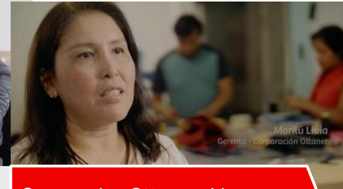
Corporacion Ottaner- Lima