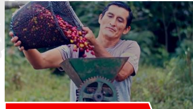
CAC Pangoa - Satipo