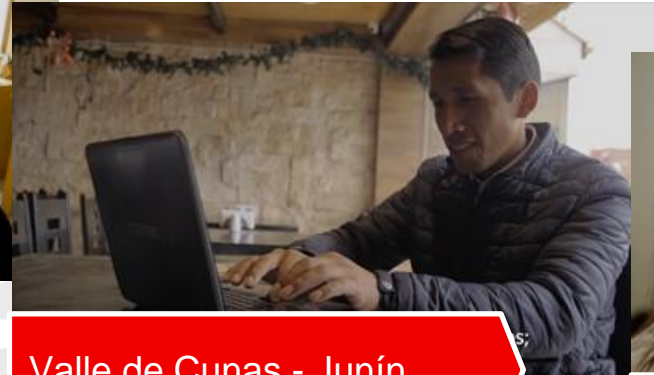
Valle de Cunas - Junín