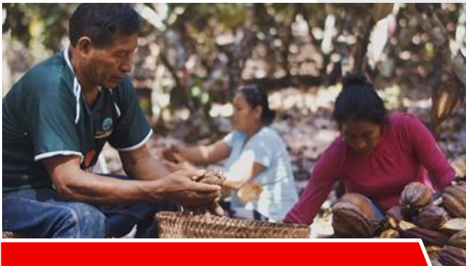
Proyecto Chazuta- Tarapoto