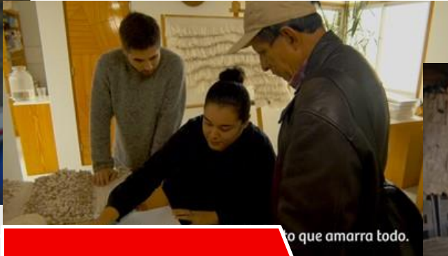
Kinua - Lima