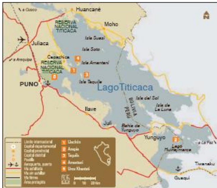
Mapa de Islas de Puno