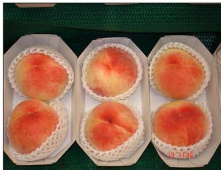
Supermercado en Tokyo , Japón