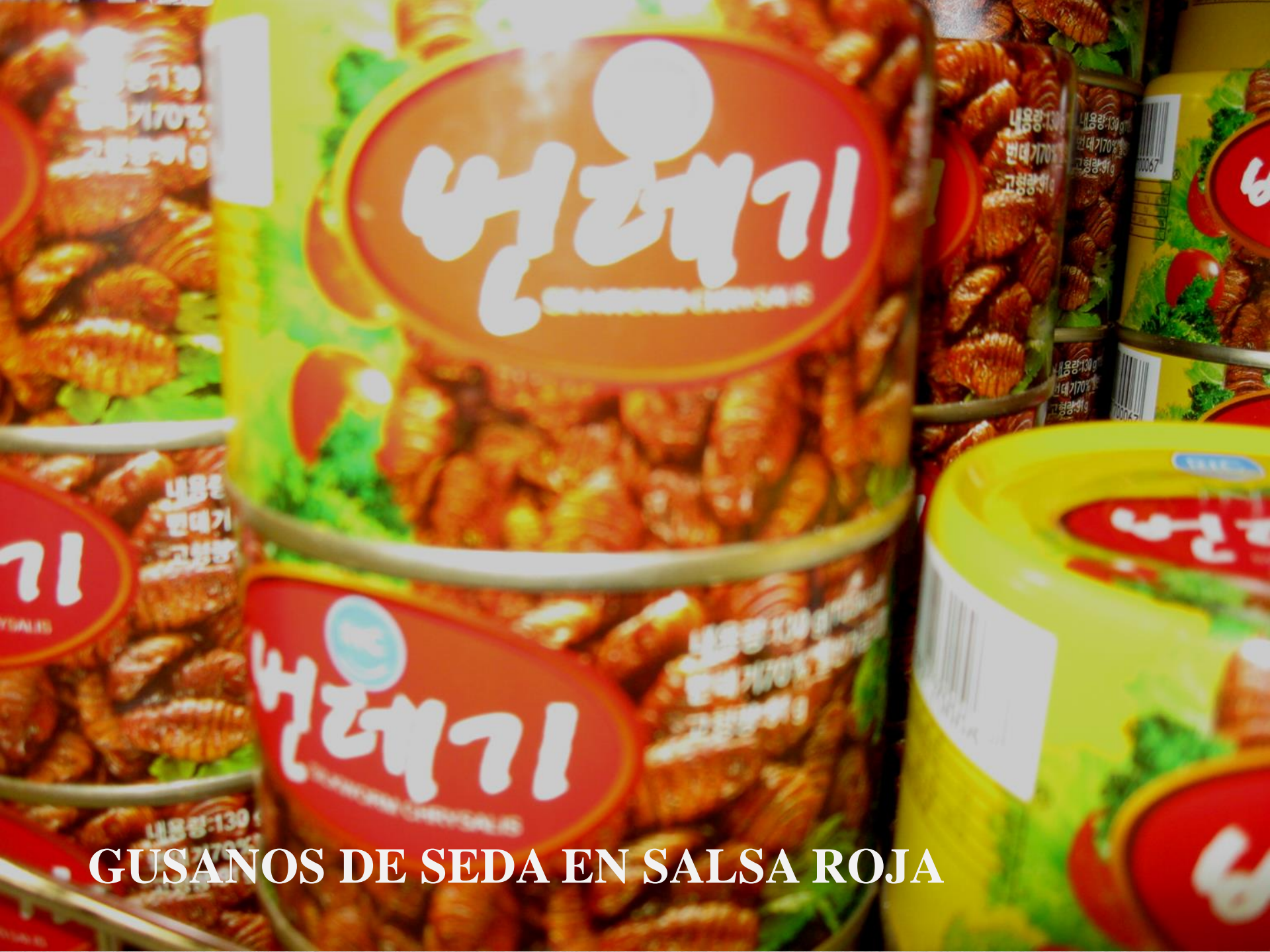
GUSANOS DE SEDA EN SALSAS ROJA