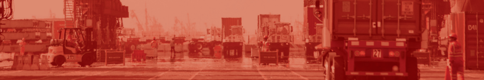
Tabla de contenidos

En la presente cartilla de orientación se presentan las siguientes secciones y temas: