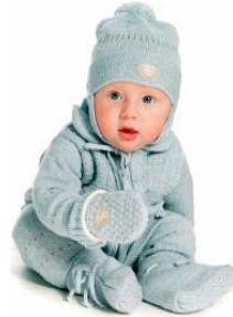
Ajuar para bebé en fibra de lana de alpaca