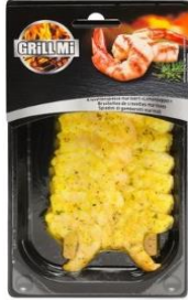
Tarta de langostinos