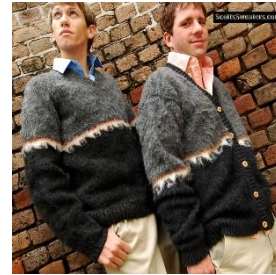
Suéter en 100% alpaca