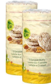
Galletas de 5 cereales (quinua)