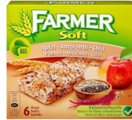
Barra de cereal con kiwicha y chía