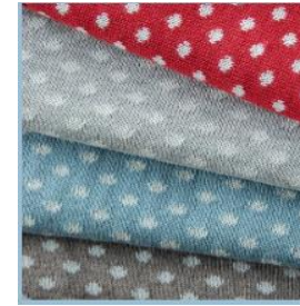
Mantas de lana de vicuña