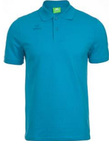
Polo camiseta en algodón pima