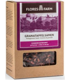
Semillas (arilos) de granada deshidratadas