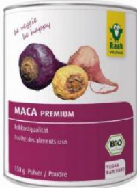
Harina de maca (superfood)