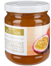
Mermelada de maracuyá y acai