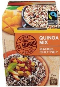
Mix de quinua con salsa de mango