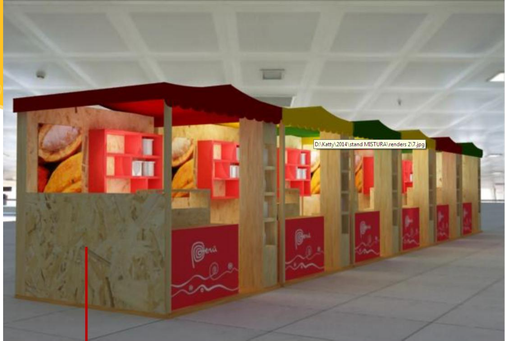
Media pared Stand 134