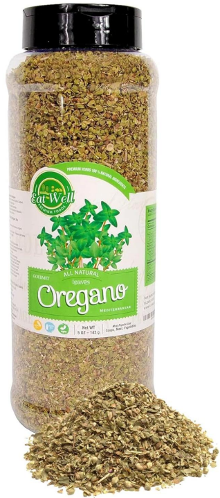
Seco y triturado