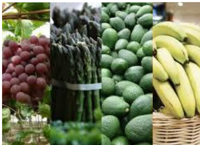
Palta, uvas, banana