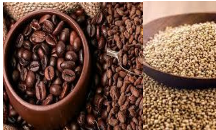
Cacao, café, quinua,