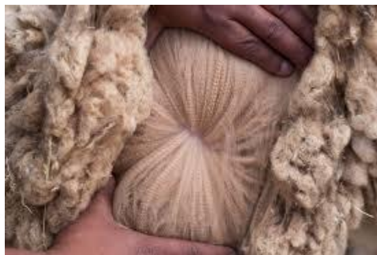
Hilados de alpaca