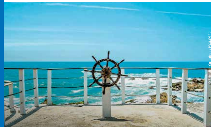
Playa La Gramita

Es un complejo sistema de habitaciones elaboradas en adobes, con muros enlucidos y algunos pintados de ocre, rojo y blanco. En 2013 encontraron una tumba de 63 personajes de la élite imperial wari, ataviados con más de 1200 objetos de plata, oro, bronce, hueso, madera esculpida, textiles y cerámica.