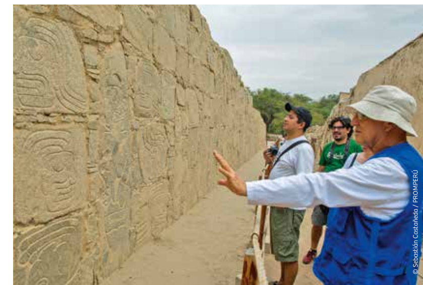
Complejo Arqueológico de Sechín