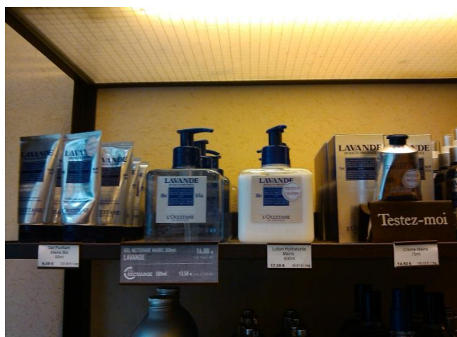
L'Occitane - Línea de cuidado para la piel de lavanda