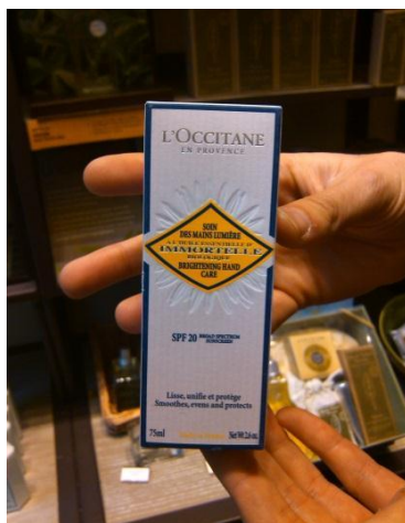
Crema de manos a base de Inmortelle (Siempreviva) – La línea de cuidado para la piel con este ingrediente fue lanzada el 2002 por la empresa