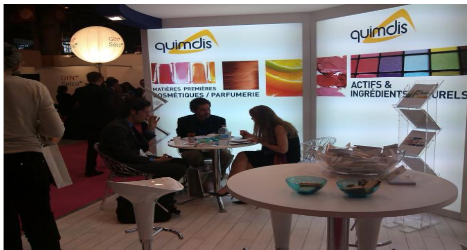
Representante de la empresa Amazon Health Products en reunión con comprador internacional Quimdis

Con las cuales se desarrolló una agenda con empresas expositoras que cuentan con la oferta de productos afín y que mostraron interés en la oferta peruana.