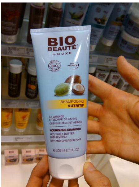
Shampoo orgánico de la Línea BIO de NUXE – Nótese que cuenta con aceite de almendras y manteca de karité