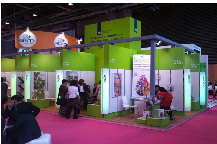
Pabellón de empresas apoyadas por CBI

Entre la oferta de las empresas colombianas se observó la empresa Neyber cuyo producto principal eran aceites derivados del camu camu.