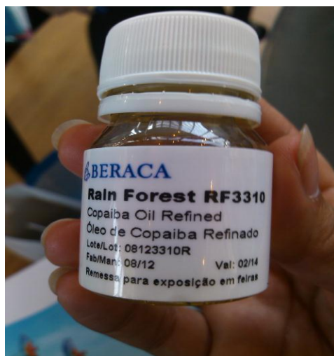
Aceite refinado de Copaiba - Beraca

Beraca se mantiene como empresa representativa de la oferta de ingredientes sobre la biodiversidad amazónica. Con una gama de productos tanto a nivel de extractos, como aceites y arcillas minerales para el cuidado de la piel, es un referente sobre la propuesta de valor agregado que se tiene que dar a la oferta peruana.