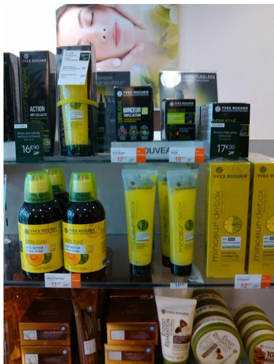
Gondola de productos en tienda Yves Rocher – Nótese en la parte inferior las cremas corporales con Karité y manteca de Shea

Entre los productos a destacar se encuentra el tratamiento concentrado para la piel con omegas extraídos de la soya, lo que representa una oportunidad para el abastecimiento de sachá inchi como ingrediente cosmético sustituto.