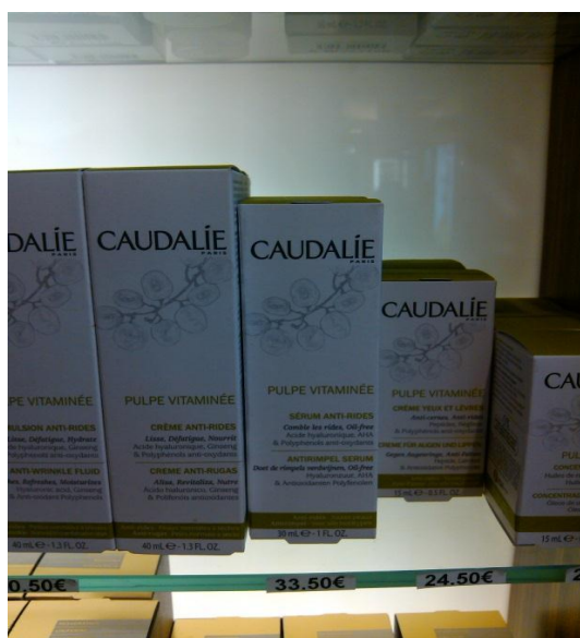
Crema antiarrugas de la marca Caudalie