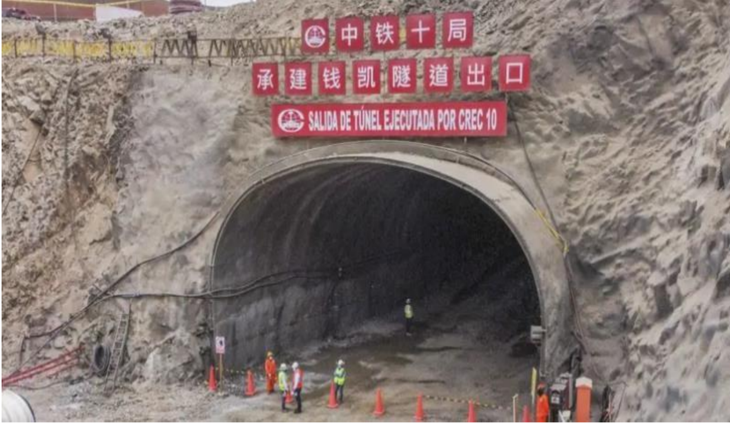
Un gran túnel bajo Chancay conecta el puerto con la Carretera Panamericana