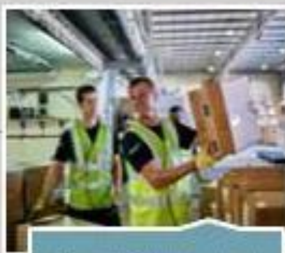
Canal de control