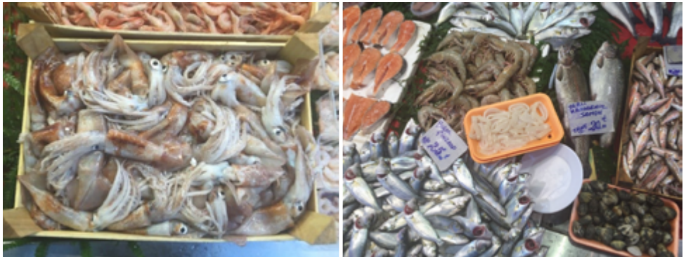
Imagen N° 6: Calamares locales en mercado (izquierda) e importados y limpios (derecha)