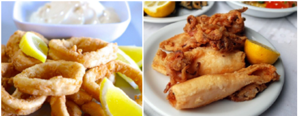
Imagen N° 1: La forma en que más se consume el calamar y la pota