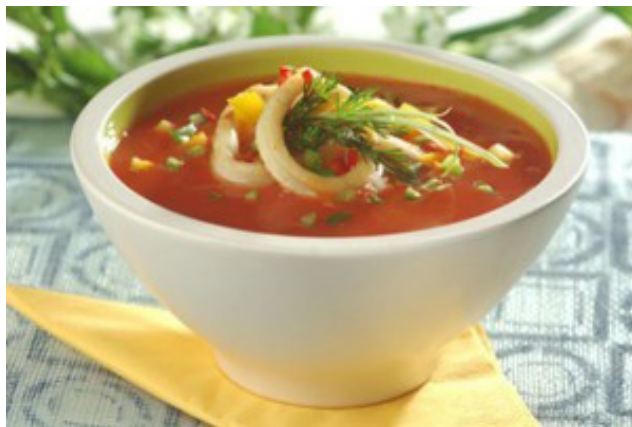
Imagen N° 3: Sopa de calamar, muy popular en la región del Egeo