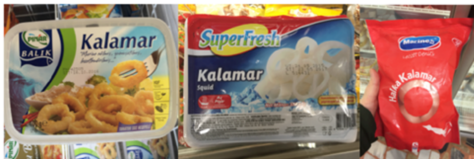
Imagen N° 4: Calamares en los supermercados, importados y procesados por empresas turcas

empresas turcas. En este último caso es difícil de encontrar producto importado en el mercado por razones de conservación.