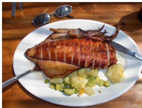
Imagen N° 2: Otras formas populares de consumo de calamar, a la plancha (izquierda) y relleno

productos del mar, los calamares frescos no suelen ser cocinados en las casas de los turcos ya que en general no se sabe cómo limpiarlo y prepararlo, siendo preferido en las casas en las que se consume el calamar congelado.