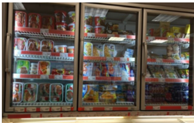
Imagen N° 7: Sección de productos congelados donde se encuentran calamares

camarones, crustáceos y similares. Estos son presentados en paquetes de 350 a 400 gramos generalmente.