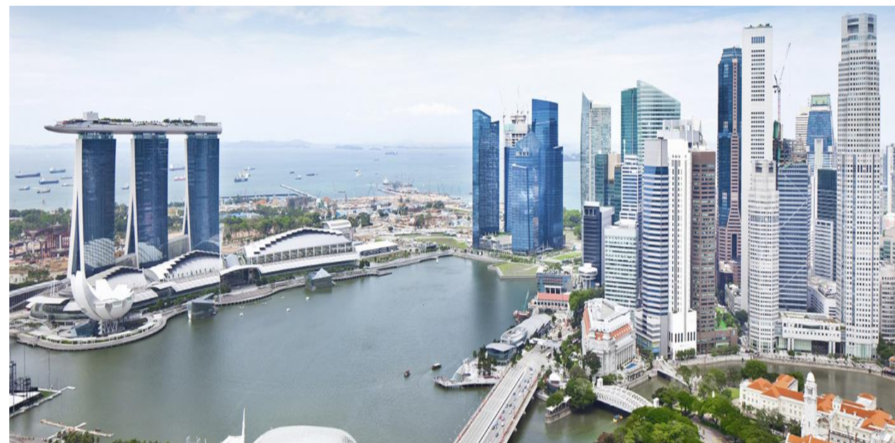
Ciudad de Singapur

USD y Kg en miles