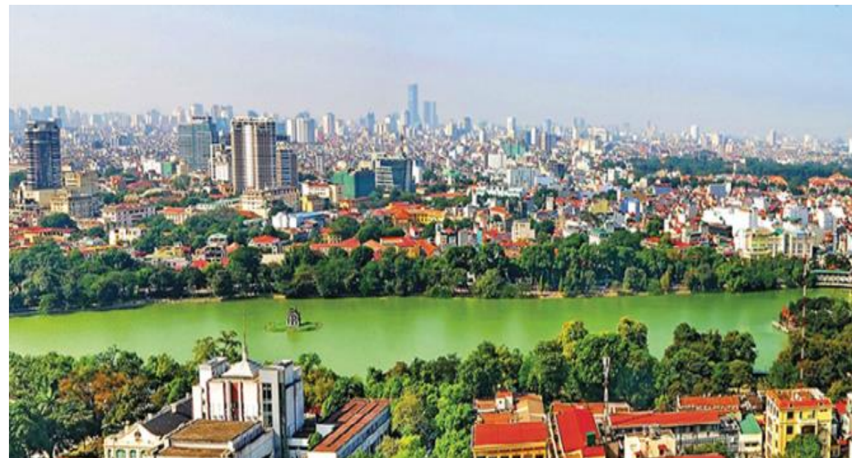
Hanoi, la capital

USD y Kg en miles Fuente: Siicex Elaborado por Oki