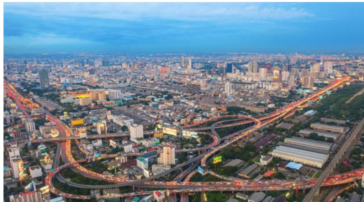
Bangkok, la capital