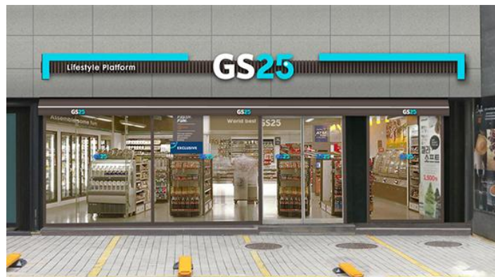
Imagen N° 03 TIENDA CONVENIENCIA GS25 - SEUL