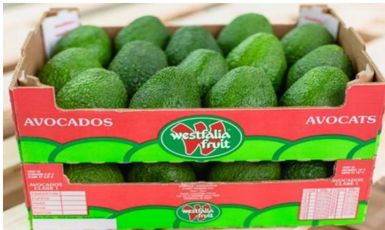
Imagen N° 01 CAJA DE PALTA CALIBRE 14

Estos calibres, significan la cantidad de paltas en unidades que entran en una caja, es importante para estandarizar la calidad del producto en el mercado coreano.