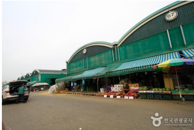
Imagen N° 02 GARARK MARKET - SEUL