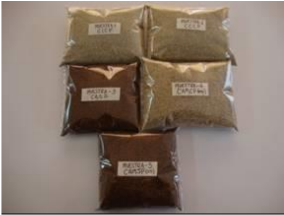
Muestras de granos de cañihua con/sin perigonio