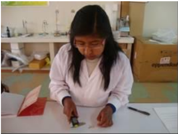
Medición del tamaño de grano (mm)