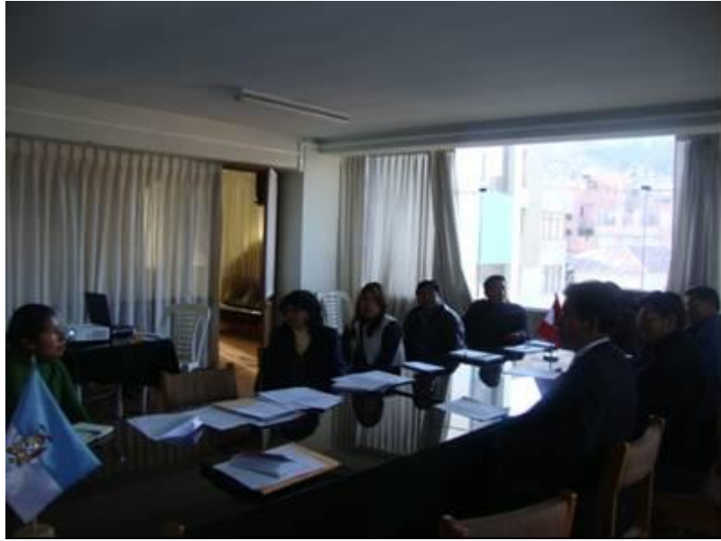
Discusión de los miembros del comité en el análisis del documento trabajo