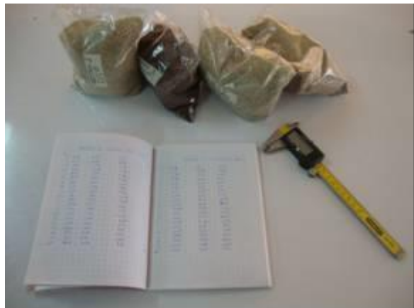
Muestras, bernier electrónico y toma de datos