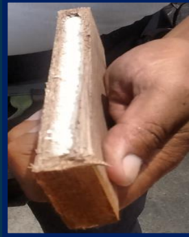
Contaminación de la carga