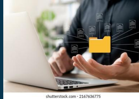
Verificaciones en bases de datos