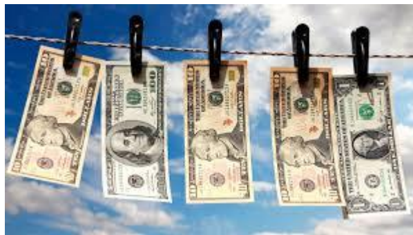
Lavado de activos