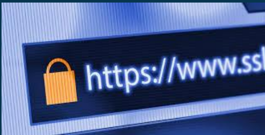
Verificación de su web