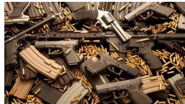
Tráfico de armas