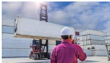
Agenciamiento de Carga