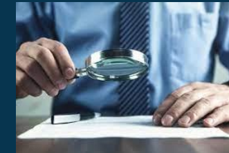
Falsificación de documentos