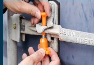
Falsificación de precintos