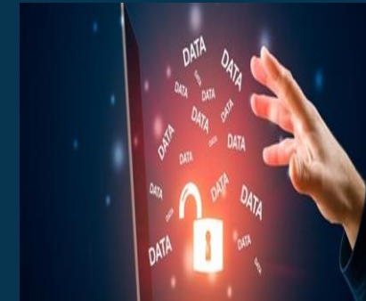
Fuga de información