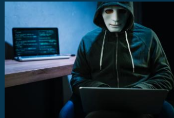
Suplantación de personal