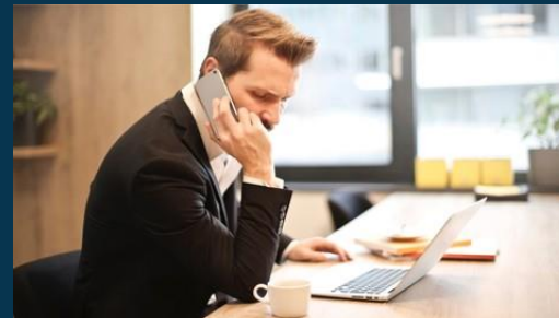
Solicitud de referencias comerciales