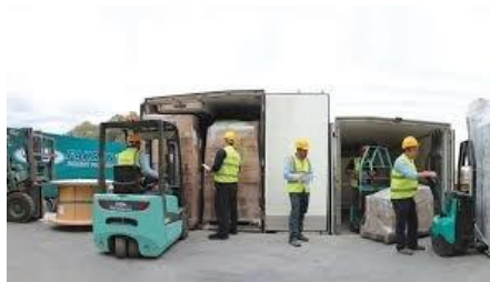
Agenciamiento de Aduana

Los operadores logísticos son aquellas empresas que por encargo de sus clientes diseñan, organizan, gestionan y controlan los procesos de una o varias fases de la cadena de suministro. Para ello, disponen de infraestructuras físicas, tecnología y sistemas de información, propios o ajenos.