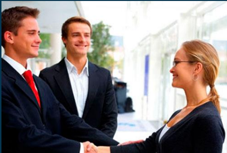
Visitas al asociado de negocio