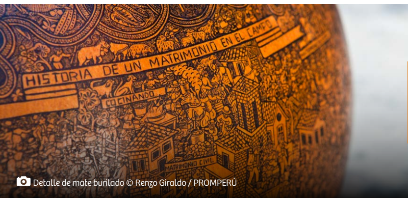
Detalle de mate burilado