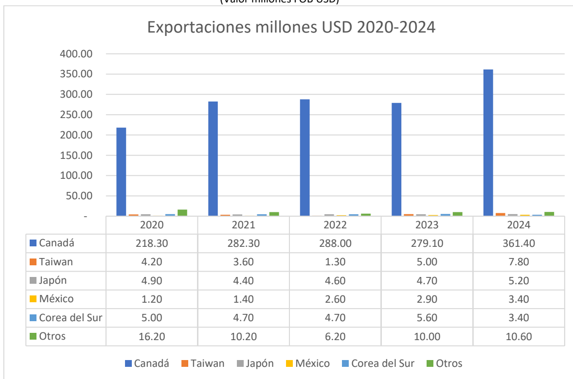
Gráfico N° 02 EXPORTACIONES DE ARANDANOS DE ESTADOS UNIDOS AL MUNDO 2020-2024 (Valor millones FOB USD)

Sin embargo, cada año la producción de Estados Unidos ha ido decayendo, por lo que esta dependiendo cada vez mas de las importaciones de Perú y de Canadá.