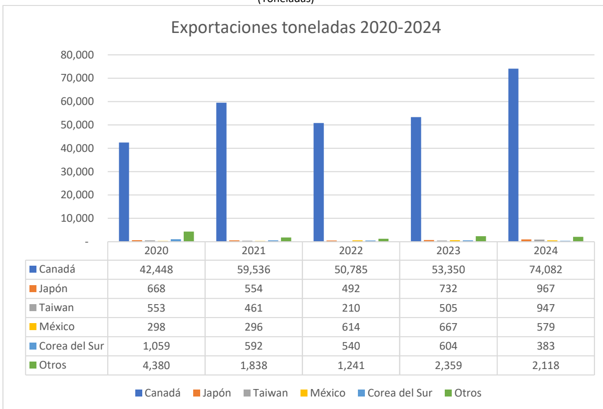
Gráfico N° 03 EXPORTACIONES DE ARANDANOS DE ESTADOS UNIDOS AL MUNDO 2020-2024 (Toneladas)