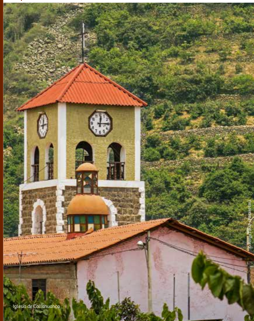
Iglesia de Callahuanca

En este pueblo de gente amable e intenso olor a campos frutales se siembra la chirimoya como producto estrella, la cual es empleada en la producción artesanal de helados, mermeladas y yogures. Date un paseo por sus sosegadas calles y sus chacras, para participar de sus actividades agrícolas o acampar en medio de la naturaleza.