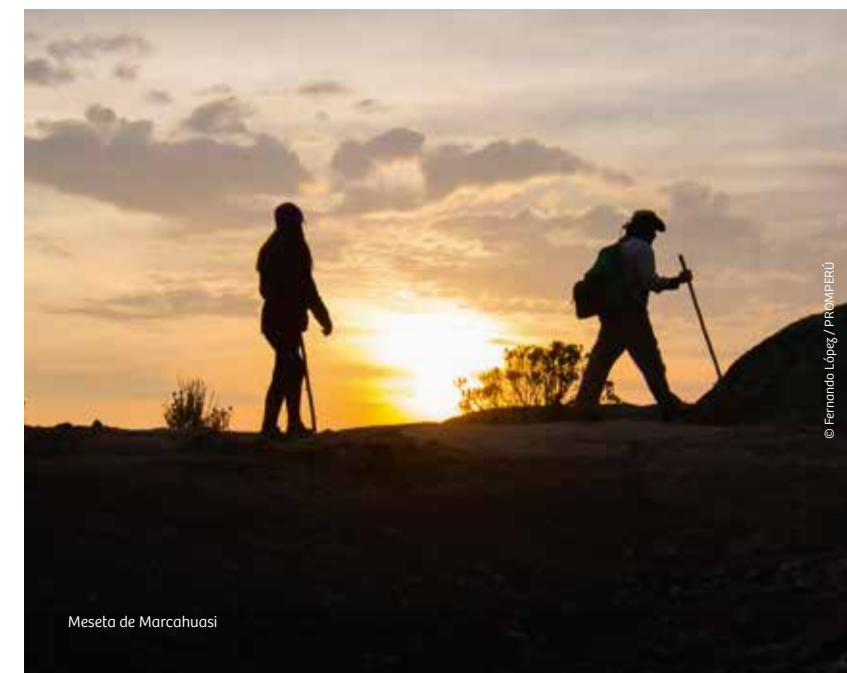
Meseta de Marcahuasi