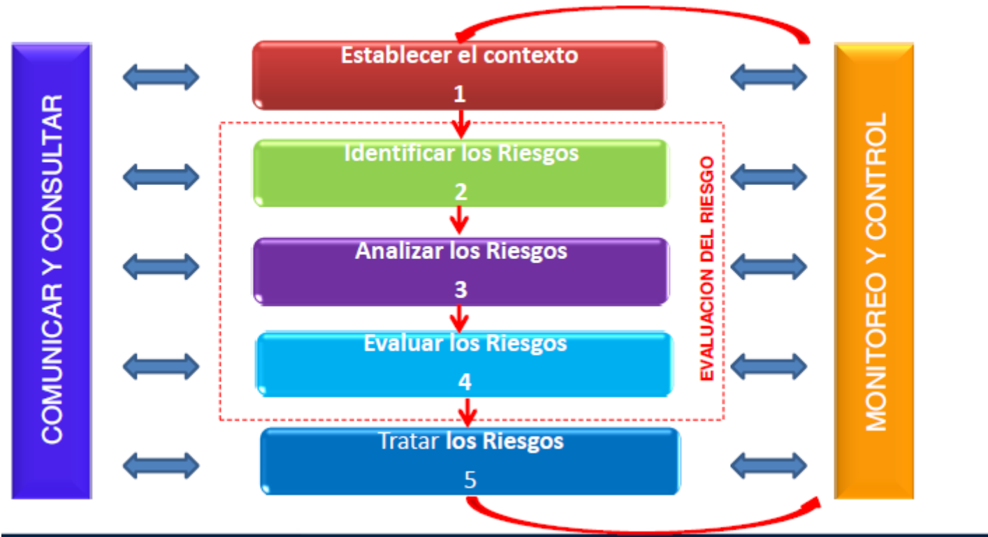
Proceso para la Gestión del Riesgo