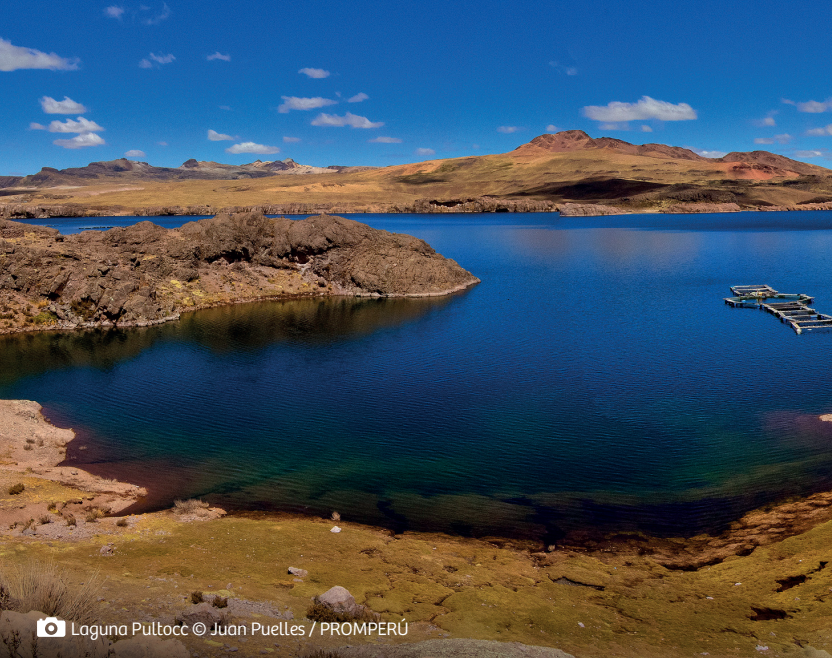
📷 Laguna Pultoc © Juan Puelles / PROMPERÚ