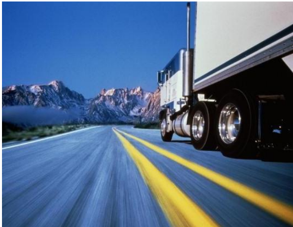
TRANSPORTE DE SUPERFICIE