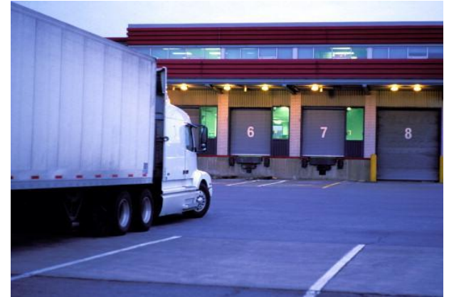
ARRIBO A BODEGAS DE DISTRIBUCION