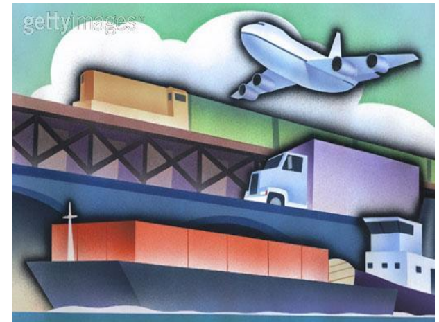
MEDIOS DE TRANSPORTE