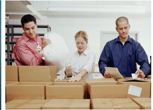
EMPAQUE Y EMBALAJE