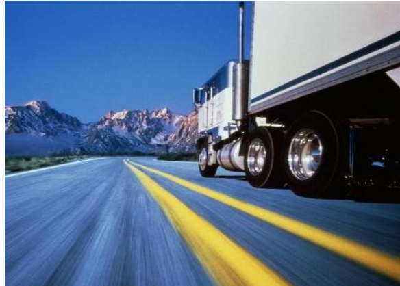
TRANSPORTE DE SUPERFICIE