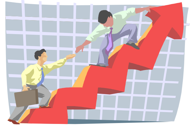
SATISFACCION DEL CLIENTE Y UTILIDADES