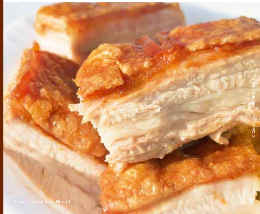
Chancho al palo en Huaral

Cuenta con intrincados pasadizos, habitaciones que albergan colecciones de piezas preíncas y torreones desde donde se tiene una vista privilegiada del litoral chancaíno. Actualmente cuenta con hotel, restaurante y piscina.