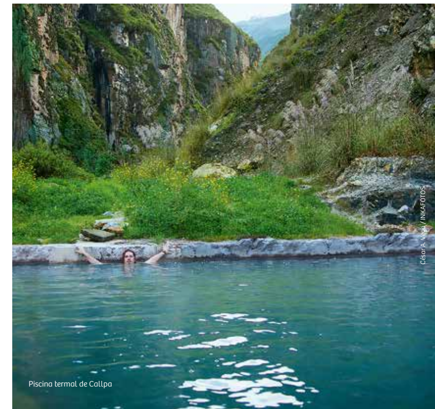
Piscina termal de Collpa