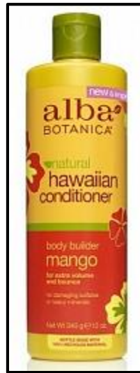
Reacondicionador con mango