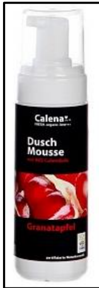
Baño de ducha con granada