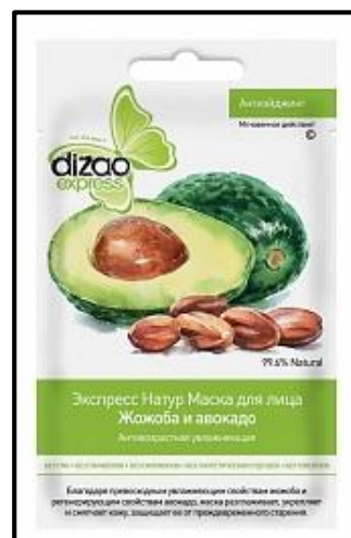
Mascarilla con jojoba y palta