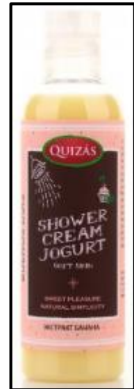
Baño de ducha con plátano