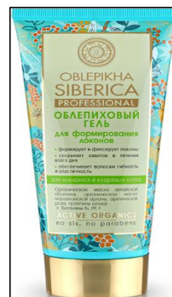
Crema para el cabello con kiwicha Sin parabenos y con certificación Wild Harvested