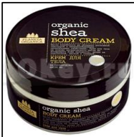
Crema para el cuerpo con kiwicha