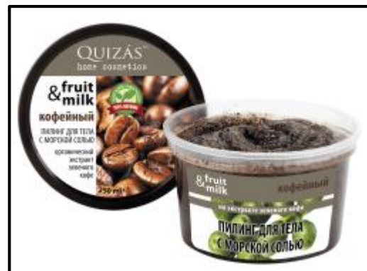
Crema para peeling con café y sal marina