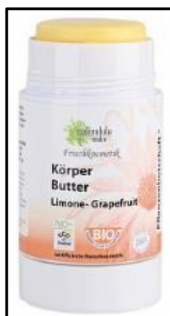
Desodorante con limón y uva