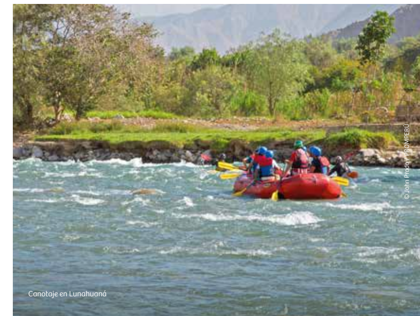
Canotaje en Lunahuaná