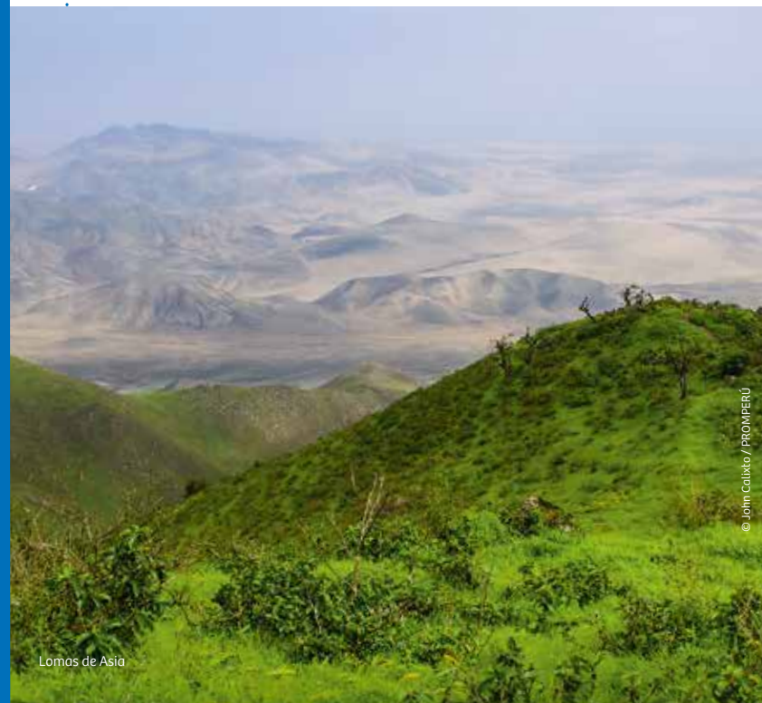
Lomas de Asia